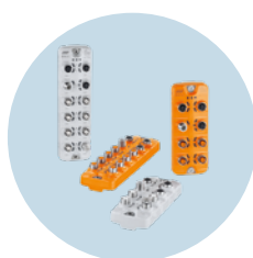
IO-Link主站 将数据和参数传输至PLC