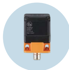
RFID读写头 集天线和评估功能于一体