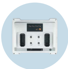
ecomatController 用于移动应用的控制器，也可用于安全应用

本公司保留纠正和修改本文内容的权利，若有更改，不再另行通知。·04.2026 ifm electronic gmbh · Friedrichstr. 1 · 45128 Essen