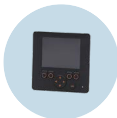
图形显示器 用于移动机械控制的可编程HMI界面