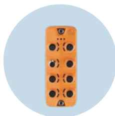
IO-Link主站 带Profinet总线接口的主站，可在现场使用