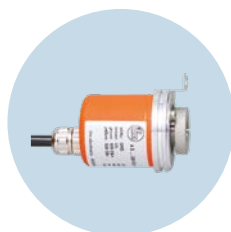
多圈编码器 位置和旋转运动的精确检测