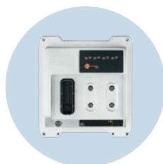
ecomatController 功能强大的32位控制器， 能够可靠地控制AGV