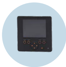
图形显示 用于移动机械控制的 可编程HMI（人机界面）

我们保留进行技术变更的权利，恕不另行通知。 - 09.2023 ifm electronic gmbh · Friedrichstr. 1 · 45128 Essen