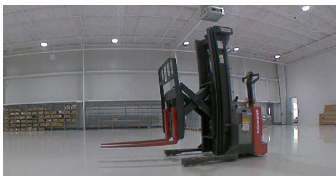
机器人平台通过2D图像和3D距离数据感知情况。

自主运输系统必须克服两大挑战：一方面是避免与物体和人员发生碰撞；另一方面是自主避让障碍物。在这方面常用的安全扫描仪只能提供有限的帮助，因为它们只能检测地面上方平面的行驶路径。而这正是摄像感知平台的优势所在：它可以处理安装在车辆周围多达6个3D PMD摄像头的信号，并对环境进行三维评估，即包括安全扫描仪视野下方的地面区域（例如，地面上的坑洞）和斜上方的视野。通过这种方式，还可以检测起重机吊钩等悬挂负载。尽管检测率很高，但强大的算法可确保几乎完全消除误检测。