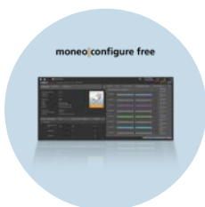
moneo|configure free 用于IO-Link底层设备 参数设置的软件

我们保留进行技术变更的权利，恕不另行通知。- 11.2023 ifm electronic gmbh · Friedrichstr. 1 · 45128 Essen