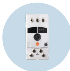
edgeGateway现场应用 在严苛工业环境中安全 传输数据