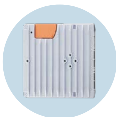
edgeGateway 边缘网关，用于将系统数据 安全发送至IT层级