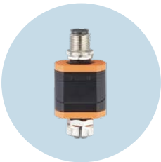
继电器适配器 输入和输出之间的电气隔离

本公司保留纠正和修改本文内容的权利， 若有更改，不再另行通知。·11.2025 ifm electronic gmbh · Friedrichstr. 1 · 45128 Essen