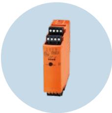
开关放大器 可靠切换大电流或交流电